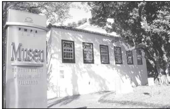
Construção colonial é tombada pelo patrimônio histórico

A novidade será oferecida nas quartas-feiras, no roteiro das 9h, e aos sábados, no roteiro das 13h30, quando os passageiros poderão descer do ônibus na parada que o veículo fará na Rua João Alfredo, 582, bairro Cidade Baixa, a cerca de cinco minutos do terminal de desembarque do city tour , para uma visita guiada ao museu. Os visitantes serão recebidos por um instrutor para realizar uma visita de aproximadamente 20 minutos pelas dependências do Museu de Porto Alegre, como é popularmente conhecido. O desembarque é