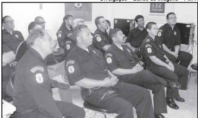
Sessenta novos agentes serão incorporados à Guarda Municipal

Neste ano, o efetivo da Guarda Municipal aumentará em 10%. Ainda no primeiro semestre estará encerrada a segunda etapa do concurso que integrará 60 novos agentes ao efetivo, que hoje é de 563. A previsão é que em outubro os novos agentes já estejam capacitados e prontos para atuar no patrulhamento cidade.