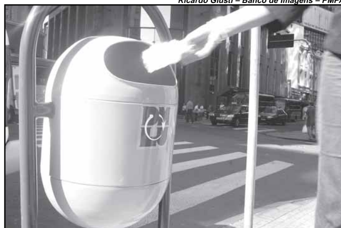
Até o final do mês, estarão instalados seis mil cestos coletores

A Divisão de Limpeza e Coleta, comemora uma melhora no