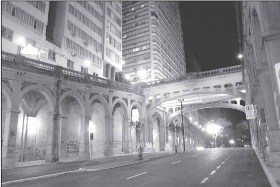
Oito câmeras de segurança vão monitorar o viaduto