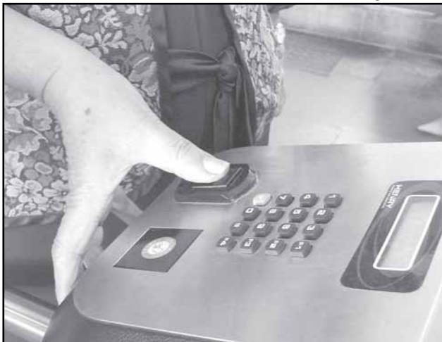
Sistema garantirá maior segurança a visitantes e servidores

João Luiz Guedes – Banco de Imagens – PMPA