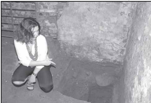
A escavação arqueológica iniciou em setembro do ano passado

Ricardo Giusti – Banco de Imagens – PMPA