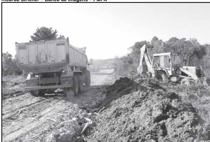
A limpeza do terreno ficou a cargo do DMLU

Duas providências de contrapartida da prefeitura para a implantação da Escola Técnica da Restinga já foram concluídas. A Secretaria Municipal de Obras e Viação (Smov) terminou o ensaibramento da rua frontal ao lote da escola; equipes do Departamento Municipal de Limpeza Pública (Dmlu) rea-