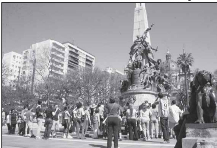
Caminhadas do Viva o Centro a Pé são realizadas duas vezes por mês, sempre aos sábados