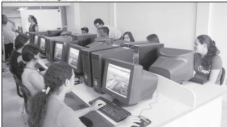
São pelo menos 10 computadores e três monitores em cada um dos mais de 30 telecentros

O software Lin Vox, projeto piloto para deficientes visuais, está em fase de teste no Telecentro de Formação da Secretaria Municipal de Direitos Humanos e Segurança Ur-