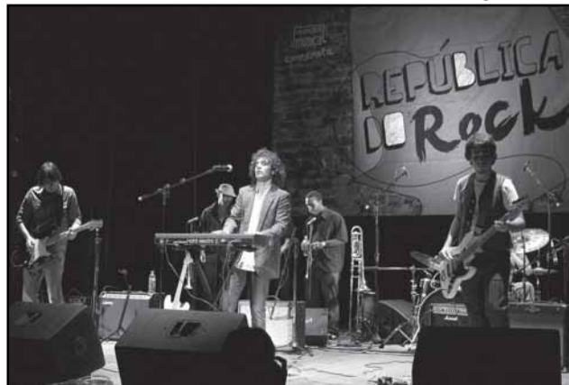
O República do Rock promove encontro de uma banda consagrada com outra em ascensão