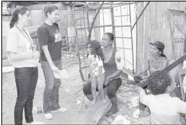
Equipes orientam famílias com crianças entre zero e seis anos