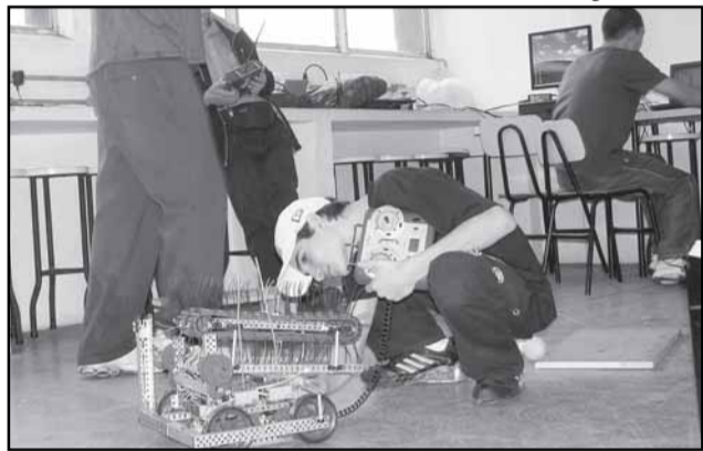
Equipe de robótica da Escola Municipal de Ensino Médio Emílio Meyer já conquistou diversas premiações