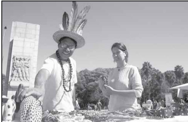
Objetivo é destacar as questões culturais dos povos indígenas que vivem na cidade

A Secretaria Municipal de Direitos Humanos e Segurança Urbana (SMDHSU) promove, de hoje até sexta-feira, a Semana Municipal dos Povos Indígenas de Porto Alegre 2010, por meio do Núcleo de Políticas Públicas para os Povos Indígenas. Em comemoração ao Dia do Índio, 19 de abril, a iniciativa tem como objetivo destacar as questões culturais dos povos indígenas que vivem na cidade.