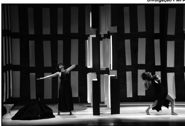
Festival é um dos maiores do mundo no contexto da videodança

De 13 a 16 de abril - Apresentação da MIV - Mostra Internacional de Videodança. Usina do Gasômetro (Av. Presidente João Goulart, 551 - Centro) - Sala P.F. Gastal. Horário: das 19 às 21h.