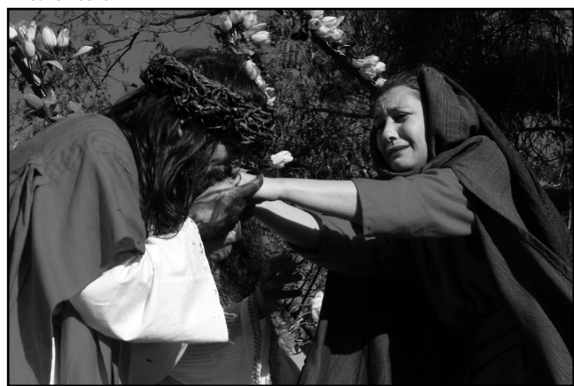
Encenação do Auto da Paixão de Cristo no Morro da Cruz

A passagem da Sexta-Feira Santa, no dia 22 de abril, será celebrada com a participação de moradores da Zona Leste da cidade, agentes culturais e artistas profissionais encenando o auto de fé que conta os últimos momentos da vida de Jesus Cristo. O evento tem início às 14h30, com encenação em meio ao público, e acompanha a procissão que reúne milhares de pessoas todos os anos, em realização da Secretaria Municipal da Cultura com a Igreja São José de Murialdo, artistas e comunidade.