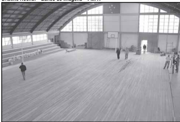
As reformas do ginásio recebeu investimento de R$ 148 mil