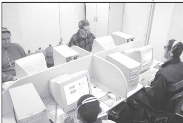
Os participantes recebem noções de Windows, Word, Excel e Internet, por meio do software Virtual Vision