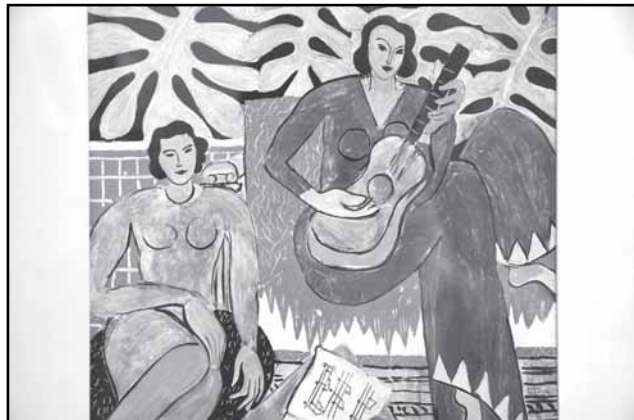
Detalhe da reprodução da obra “A música”, de Henri Matisse

O setor de biblioteca da Secretaria Municipal de Educação (Smed) promove uma semana de comemoração ao Ano da França no Brasil. A mostra com 16 reproduções de obras de artistas franceses como Pierre-Auguste Renoir, Oscar-Claude Monet e Eugène Delacroix estarão expostas no saguão do órgão até o dia 14.