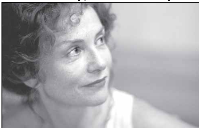
Isabelle Hupert é uma das estrelas do festival com a peça Quartett