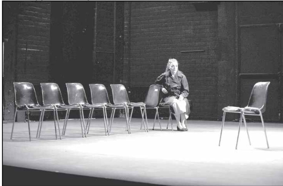
Le Douleur, com o francês Patrice Chéreau, estará no Teatro São Pedro