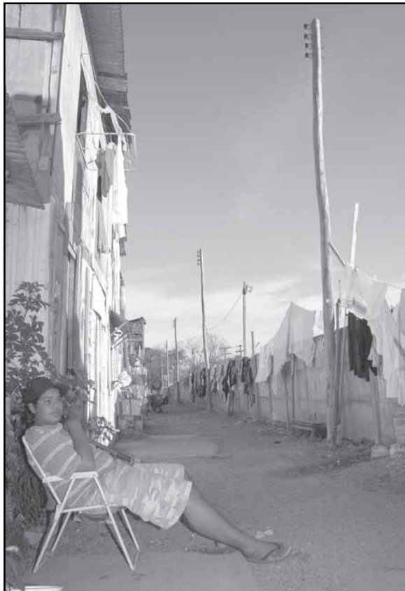
A instalação da rede provisória é uma conquista dos moradores que convivem com instalações precárias

Como parte da Rede para a Sustentabilidade da Vila Chocolatão, a companhia estadual promoverá trabalho educativo sobre o uso adequado da energia elétrica, de forma a instrumentalizar os moradores para a situação diferenciada. Na reunião, também foram feitos encaminhamentos referentes à responsabilidade comunitária com a manutenção do sistema de fornecimento de energia.