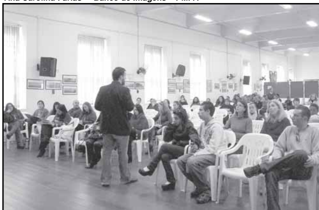
O documento foi elaborado a partir das resoluções debatidas em julho na Capital