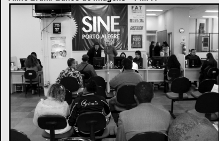
Funções de padeiro e empacotador entre as vagas