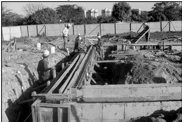
São redes coletoras, emissários e estações de bombeamento