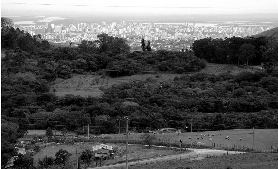
Passeio no campo mostra a face rural da cidade, não muito distante do centro urbano