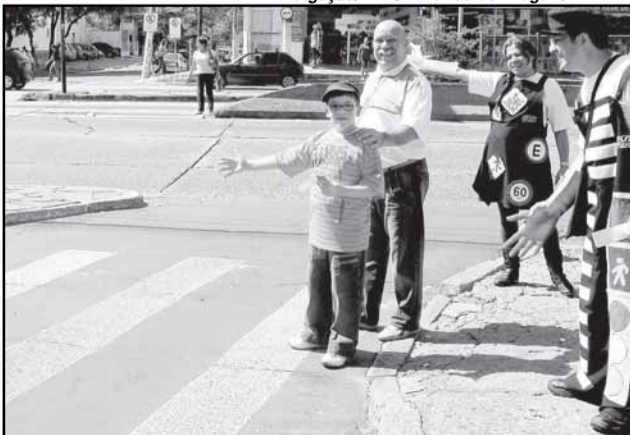
Agentes da EPTC incentivam a população a fazer o novo sinal