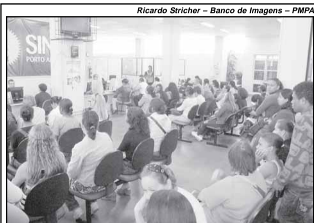
Funcionamento é de segunda a sexta-feira, das 9h às 17h

— Atualmente no banco de dados do Ministério da Saúde, o Registro Nacional de Doadores de Medula Óssea (Redome) tem quase um milhão de cadastros. O número ideal seria de, pelo menos, 5 milhões, pois a chance de compatibilidade entre doador e receptor é de uma em 100 mil. No Brasil essa chance pode ser ainda menor, de uma em um milhão, em decorrência da mistura de raças característica dos brasileiros.