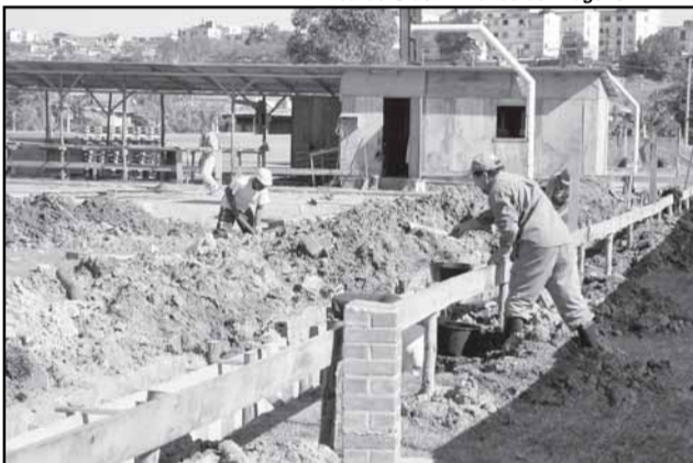
Capacitação para a construção civil e um dos focos do projeto