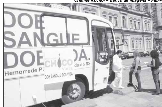
Unidade móvel cadastrou doadores de medula no Largo Glênio Peres

— O Brasil conta com 55 centros para transplantes com doadores aparentados e 14 para transplantes com doadores não-aparentados, entre eles, o da Universidade Federal do Rio Gran-