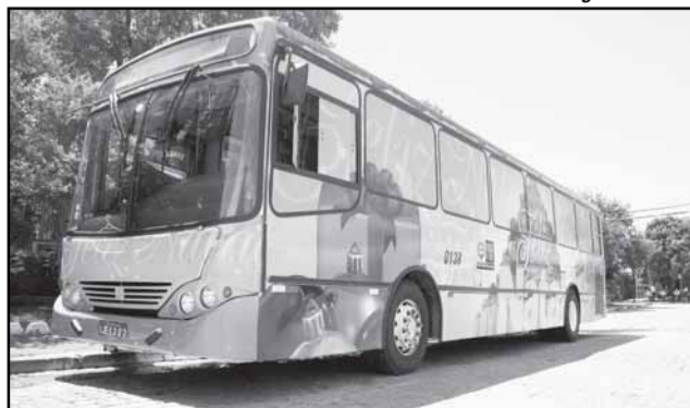
O Ônibus Natalino, da Carris, circulará em diferentes linhas até a véspera do Natal