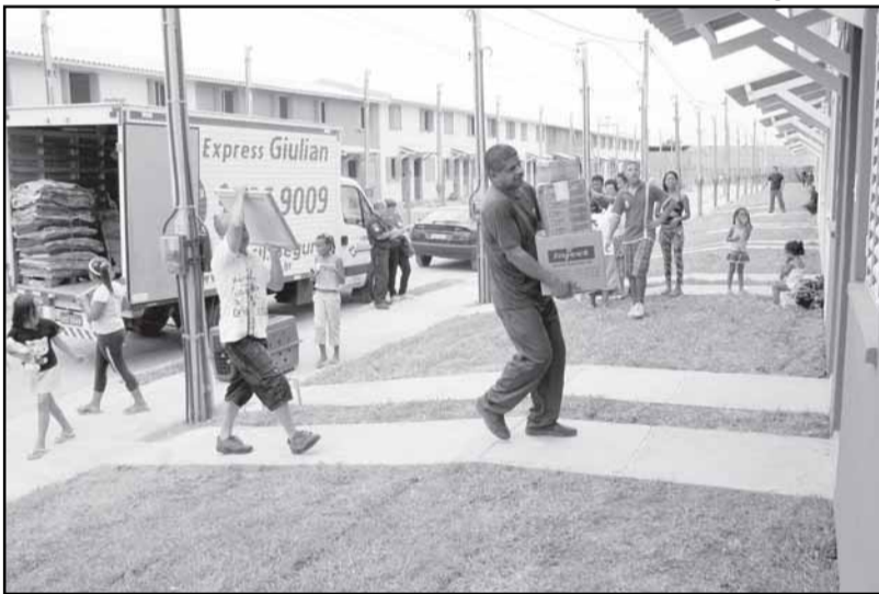
A remoção faz parte de um processo iniciado em outubro