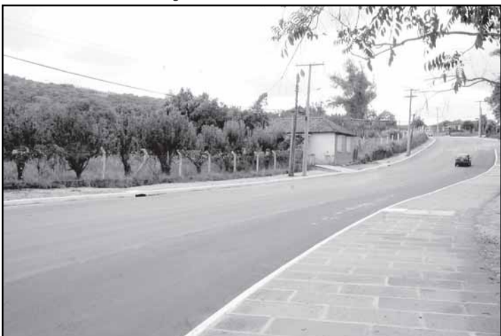
Obra tem 3,3 quilômetros, da Estrada Cristiano Kraemer até a Costa Gama