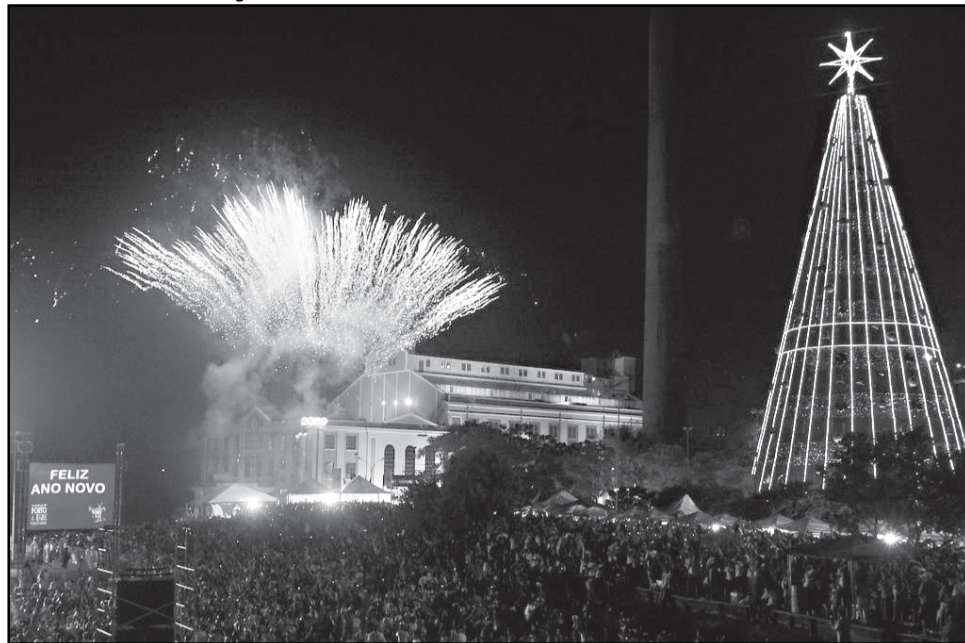
Musica e shows de fogos de artifício para um público estimado de 70 mil pessoas