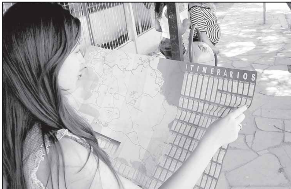
Trinta mil mapas distribuídos com informações sobre linhas de ônibus