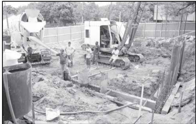
Casa de Bombas Santa Terezinha está em construção e terá 361m 2

No decorrer de 2009, o Departamento de Esgotos Pluviais (DEP) iniciou obras contra alagamentos em diversas regiões da cidade. O investimento nestas novas obras atinge R$ 18,4 milhões. Em 2010, serão implementadas mais obras como a reforma e ampliação das casas de bombas número 5 e Vila Farrapos, a obra de macrodrenagem da Vila Minuano no Sarandí, que inclui construção de diques no Arroio Passo das Pedras, construção de casas de bombas e implantação de coletor geral.