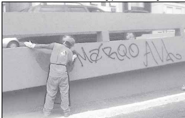
Limpeza dos locais públicos é realizada por equipe do DMLU