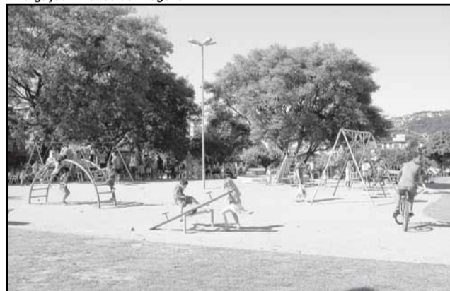
Praça Irene Stricher, no bairro Cavalhada, foi revitalizada

No balanço das atividades desenvolvidas em 2009, a Secretaria Municipal do Meio Ambiente (Smam) destaca o investimento de R$ 1.758.331,51 para executar melhorias nas praças da cidade, a agilidade no processo de liberação de licenças e o reforço nas ações de educação ambiental.