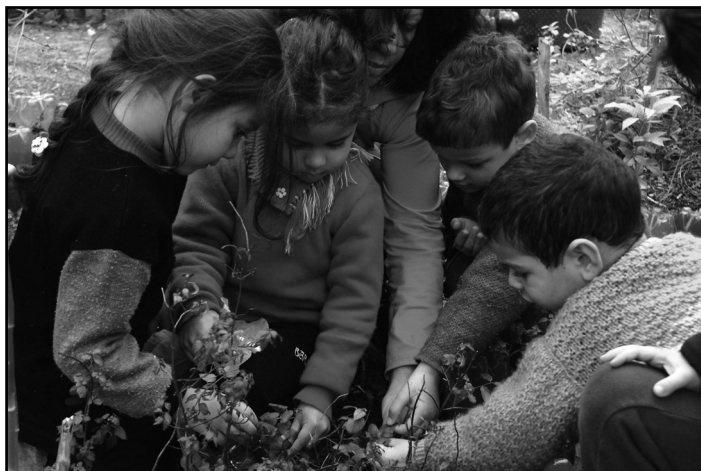
Contribuições auxiliam cerca de 50 mil crianças e adolescentes

Por que doar - As contribuições auxiliam cerca de 50 mil crianças e adolescentes atendidos diariamente pela rede municipal e conveniada. Os recursos permitem qualificar a rede de atendimento, auxiliar no processo de inclusão de jovens cidadãos que vivem em vulnerabilidade social e evitar que outras crianças e adolescentes passem a fazer da rua seu local de subsistência e moradia. Além disso, quem contribui com o Funcriança está decidindo que parte do seu imposto fica em Porto Alegre, para o desenvolvimento de programas e serviços dirigidos à nossa infância e juventude.