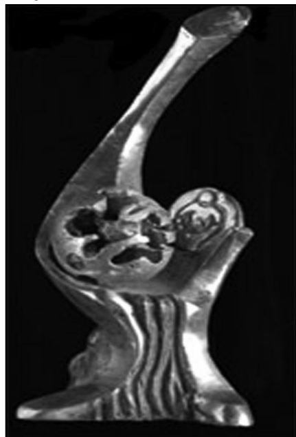
Campanha é vencedora nacional na categoria Cidades

Campanha do Novo Sinal recebe hoje, 2, o Prêmio Volvo de Segurança no Trânsito 2009/2010 como vencedora nacional na categoria Cidades, em evento no Teatro Paulo Autran, em Curitiba, a partir das 19h, com a presença do prefeito. O prêmio é um reconhecimento à campanha da Prefeitura de Porto Alegre, desenvolvida pela agência Paim Comunicação, propondo um novo gesto de cidadania entre pedestres e motoristas nas faixas de segurança onde não há semáforo. O projeto foi inscrito pela Empresa Pública de Transporte e Circulação (EPTC), por meio da Assessoria de Educação para o Trânsito.