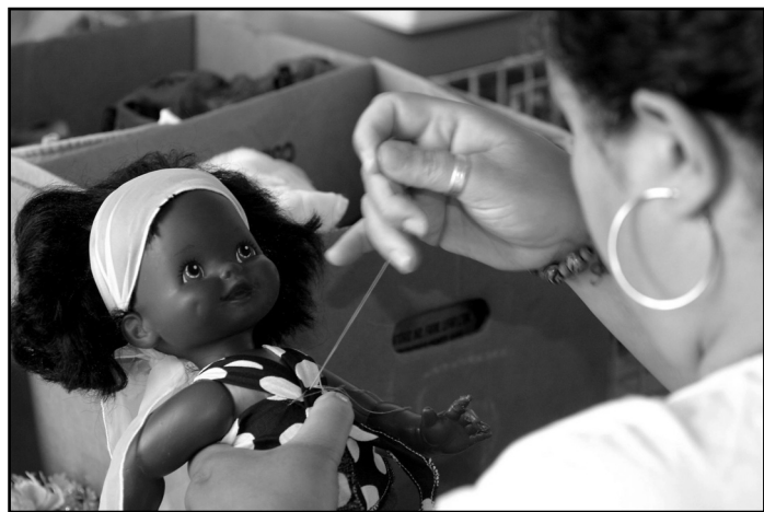
Brinquedos serão distribuídos para 20 mil crianças

servidores da prefeitura e seis voluntários. O trabalho começa com a triagem e o cadastramento dos brinquedos, que depois vão para conserto e limpeza. Cerca de 115 instituições cadastradas pela prefeitura serão beneficiadas. Colaboram com a campanha empresas, escolas e organizações não-governamentais da Capital.