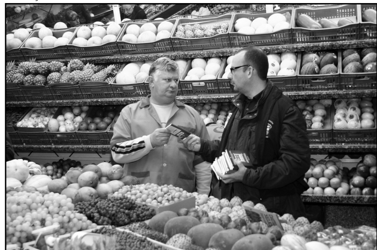
Em 12 meses, assalariados e ocupados tiveram aumentos de 3,4% e 3,5%

quanto para assalariados. Os ocupados ganharam, em média, em setembro, R$ 1.735. Já os assalariados, R$ 1.712. Contudo, nos últimos 12 meses, tanto assalariados quanto ocupados tiveram aumentos de 3,4% e 3,5%, respectivamente.