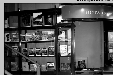
Livraria funciona nos altos do Mercado Público, loja 38

Uma boa notícia para os que apreciam a produção cultural de Porto Alegre: está de volta a Livraria Ilhota, tradicional ponto de venda dos livros e CDs