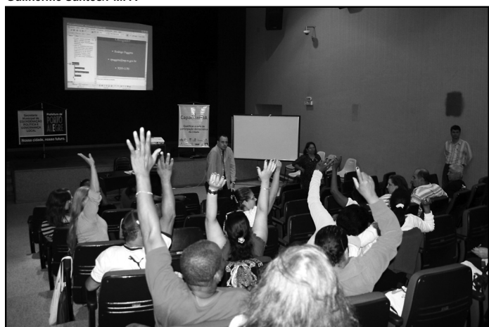
Programa busca qualificar o processo de gestão pública democrática

Os finais de semana, têm reunido os atores sociais da rede de participação democrática de Porto Alegre. Os delegados e demais lideranças das regiões Ilhas, Centro, Partenon, Lomba do Pinheiro, Sul, Extremo-Sul, Restinga, Leste e Nordeste já foram capacitados. Nos dias 11 e 12, será a vez das capacitações das regiões Norte, Eixo-Baltazar, Humaitá-Navegantes e Noroeste, encerrando as 17 regiões do OP.