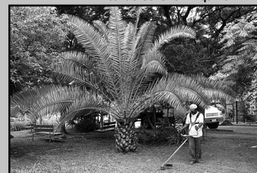
Contratação prevê poda em 11 mil vegetais

A área de compras e serviços da Secretaria Municipal da Fazenda (SMF) realizará pregão eletrônico para contratação de empresa especializada na execução de serviços de poda e remoção de árvores nas áreas públicas. O pregão ocorre amanhã, 14, a partir das 14h. A empresa vencedora prestará serviços para a Secretaria Municipal do Meio Ambiente (Smam), por 12 meses, renováveis por um prazo de até 60 meses. A contratação prevê poda em cerca de 11 mil vegetais e remoção de outras 2 mil árvores ao ano. O edital pode ser retirado em www.cidadecompras.com.br .