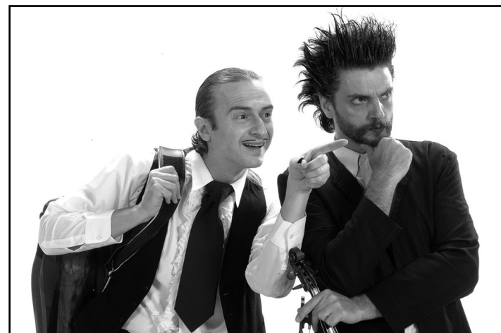
Vencedores serão conhecidos hoje, no Renascença