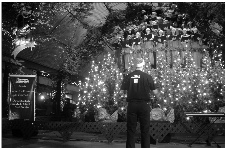
Haverá show com a árvore cantante formada pelo Coro do Dmae

P elo segundo ano, a magia do Natal toma conta dos jardins da Estação Moinhos de Vento (Rua 24 de Outubro, 200). Quarta-feira, 15, o Departamento Municipal de Água e Esgotos (Dmae) comemora o seu aniversário de 49 anos com um espetáculo de luz, som e cor. A partir das 20h, com entrada gratuita. O show ficará por conta da árvore cantante formada pelo Coro