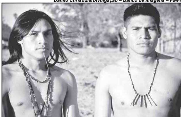
Livro traz ensaio fotográfico do povo guarani

Drummond lembrou que a Clínica é dirigida aos usuários cadastra-