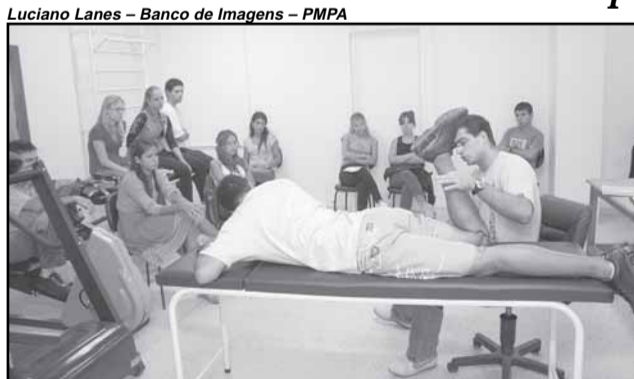
Foram cerca de cinco mil atendimentos desde março de 2008

Em sua mais recente edição, a revista médica “Physikos”, publicação nacional patrocinada pelo grupo Ache, destaca o sucesso da Clínica Pública de Fisioterapia Esportiva, iniciativa da Secretaria Municipal de Esportes, Recreação e Lazer (SME) em parceria com o hospital Mãe de Deus e do Centro Universitário Metodista IPA e que funciona no ginásio Tesourinha.