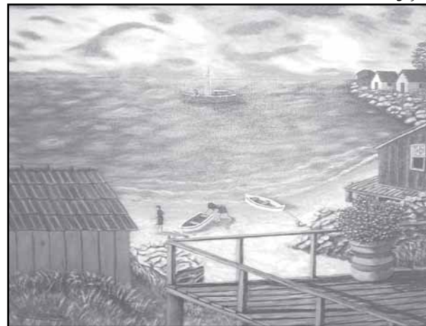
Pintura de Guimauri