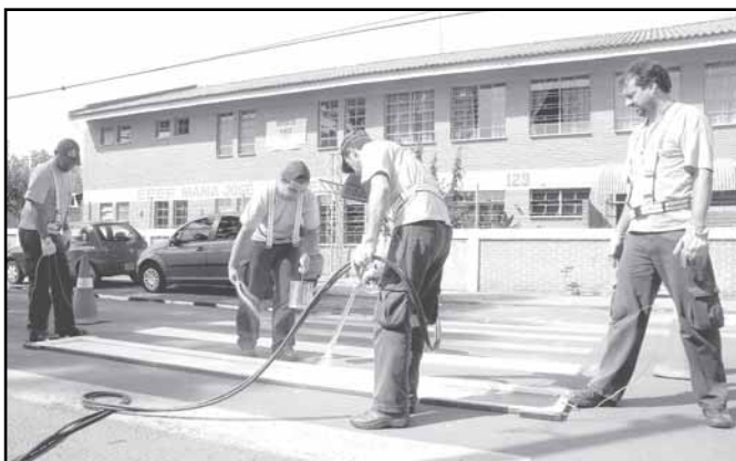
Faixas de segurança são repintadas diariamente pela EPTC

O diretor de trânsito da EPTC espera que a sinalização seja respeitada. “O motorista precisa ter consciência de que a preferência é sempre do pedestre no momento da conversão. Com o reforço dessas placas, a nossa expectativa é que o condutor fique mais atento aos conflitos ocorridos no trânsito”.