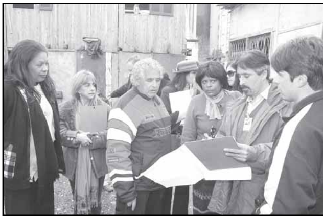
Vistoria foi solicitada pela Secretaria de Coordenação Política e Governança

ca de 200 famílias para área localizada na avenida Manoel Elias, na região leste da cidade. A vistoria ocorreu por solicitação feita pela Secretaria de Coordenação Política e Governança Local, em ofício dirigido à direção da estatal de energia elétrica em abril, resultado de processo de negociações envolvendo a prefeitura, CEEE e o Tribunal Regional Federal da 4ª Região, proprietário do terreno.