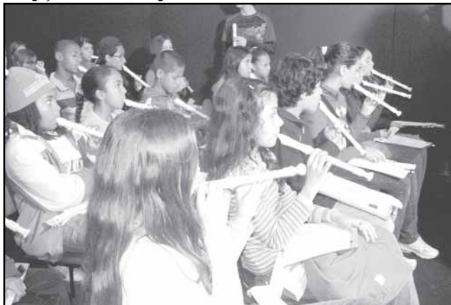
Nova fase terá 12 alunos da rede municipal

Doze estudantes de escolas municipais foram selecionados para a segunda etapa do projeto Orquestra de Câmara Jovem do RS. Ao todo, 45 alunos seguirão a formação musical oferecida pela orquestra, organizada pela Federação das Associações de Municípios do Rio Grande do Sul (Famurs).