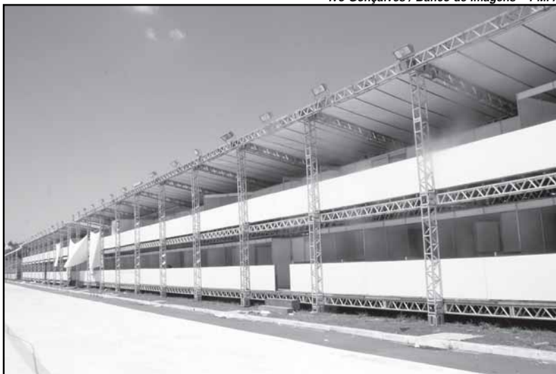
Pista aumentou em quase 50 metros, totalizando em 338 metros

A s novidades que estão sendo preparadas para os desfiles do Carnaval, dias 12, 13 e 14, no Complexo Cultural do Porto Seco, foram conferidas pelo prefeito na última semana. “Temos aqui avanços expressivos que irão melhorar muito a dinâmica dos desfiles, como a nova arquibancada e a melhoria na qualidade de sonorização da pista. O Carnaval de Porto Alegre tornou-se a maior festa da cultura popular da cidade com sua magnitude e beleza. E é isto que a cidade quer apresentar, um grande espetáculo cultural”, destacou.