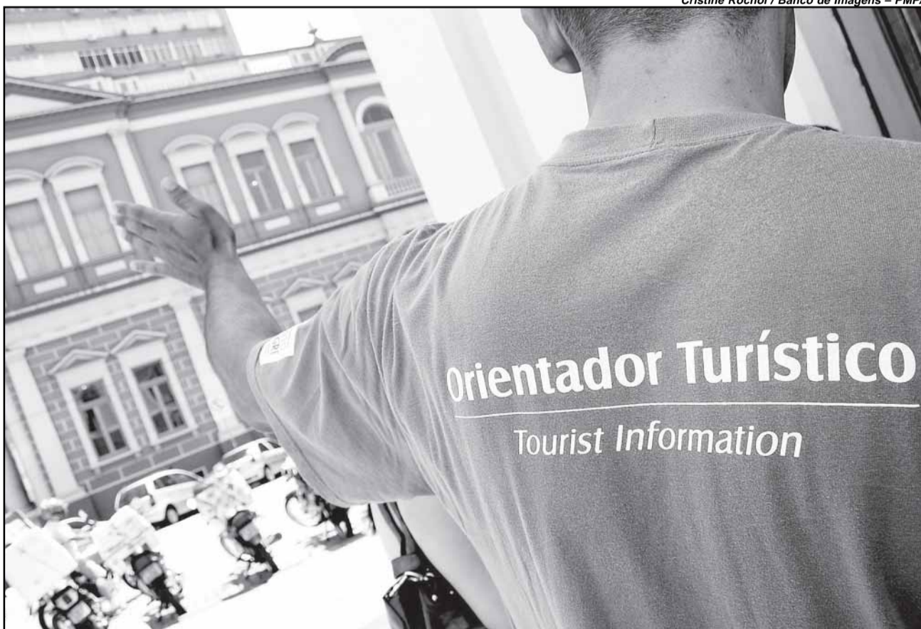
Roteiro partirá do SAT Mercado Público às 10h do dia 6