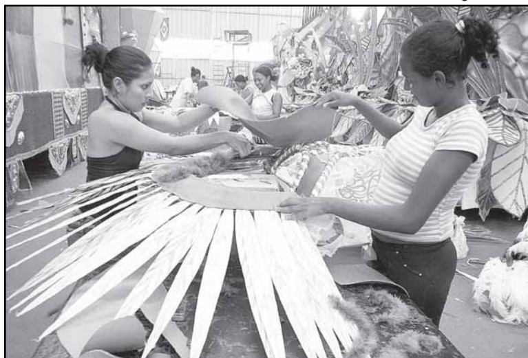
IAPI se apresenta com 1,4 mil integrantes e 18 alas