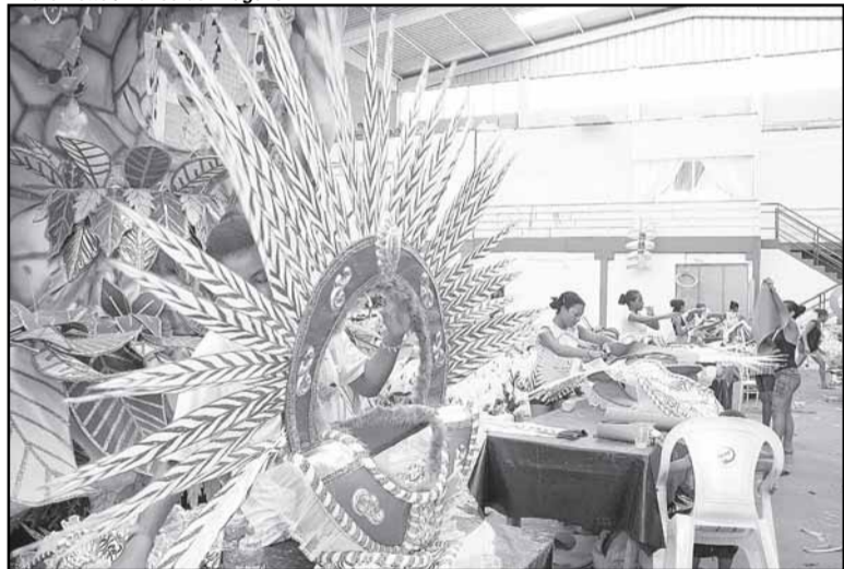
Escola vai com cinco carros alegóricos

A União da Vila do IAPI será a quarta escola a desfilar no Carnaval de Porto Alegre. Fundada em 21 de março de 1980, a agremiação homenageará o cinquentenário da capital federal, com o tema enredo “Brasília, 50 anos de um sonho dourado no coração do Brasil”. Este ano a escola completa 30 anos. (fotos)