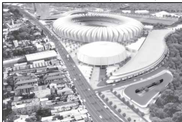
O projeto Gigante para Sempre do Sport Club Internacional é uma das sete ações previstas