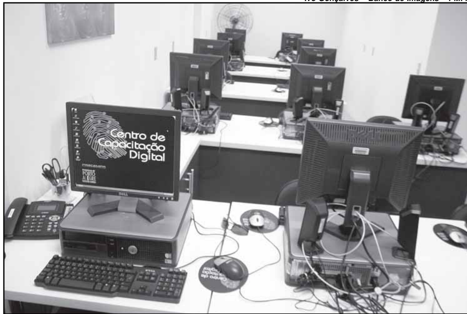
Inaugurado em 2009, Atelier Digital oferece novas vagas