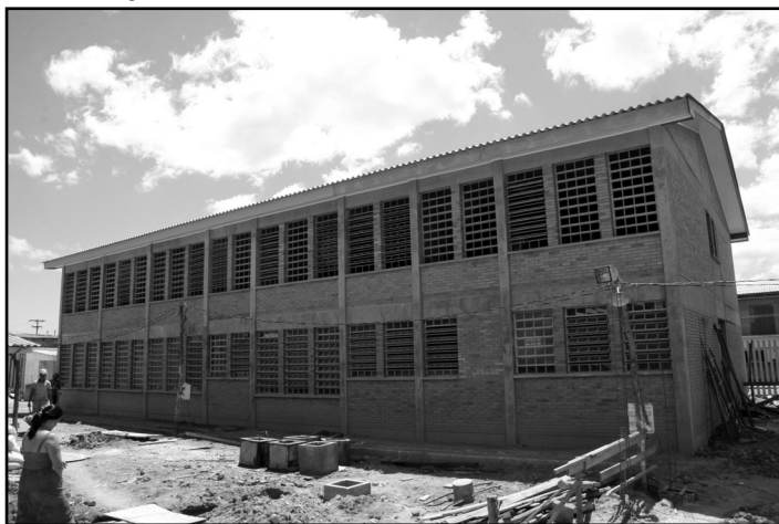
Primeira parte das construções estará finalizada até março

além dos alunos já atendidos no ensino fundamental e na educação de jovens e adultos (EJA). O total investido ficará em R$ 4,6 milhões. Construída há sete anos emergencialmente para atender a comunidade do entorno, que cresce rapidamente, a instituição trabalha, desde a fundação, em 12 salas de aula de madeira. Com a nova sede, os estudantes terão mais organização e conforto, com toda a estrutura de alvenaria.