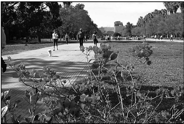
Primeiro roteiro será dia 8, com saída às 10h, do SAT Mercado do Bom Fim

N os meses de janeiro e fevereiro o programa Viva o Centro a Pé irá retomar as Caminhadas Turísticas de Verão. Conduzidos por um guia de turismo, que repassará informações históricas e curiosas sobre os locais visitados, os participantes irão conhecer prédios, monumentos, equipamentos culturais e áreas verdes que são atrativos turísticos e fazem parte do patrimônio cultural e ambiental da cidade. Além disso, em cada edição, sempre haverá visita interna a um equipamento. A realização é das secretarias municipais de Turismo, Planejamento Municipal e Cultura, Viva o Centro e Gabinete da Primeira-Dama.