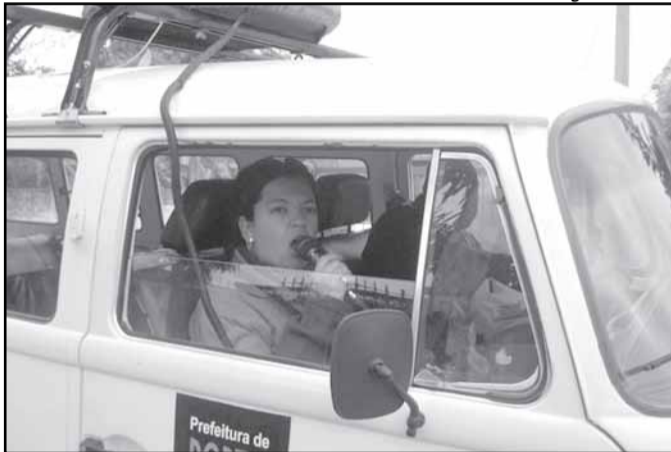
Carro de som é usado para informar as comunidades sobre o serviço

Em seguida, será a vez da Restinga, onde o DMLU chega em 6 de julho, começando pela comunidade do Barro Vermelho. Nos dias seguintes, serão percorridas a Restinga Velha, Coema, Chácara do Banco e Flor da Restinga, uma vila a cada dia. De 13 a 17 de julho, serão atendidos os moradores de comunidades da Região Sudeste: vilas Maria da Conceição, São Pedro, Salvador França, Santa Clara, Teresina e Gaúcha. Sete comunidades localizadas na Região Nordeste serão beneficiadas de 20 a 24 de julho. Nos últimos cinco dias do mês, será a vez de recolher entulhos em oito vilas localizadas nos bairros Teresópolis, Medianeira e Nonoi.