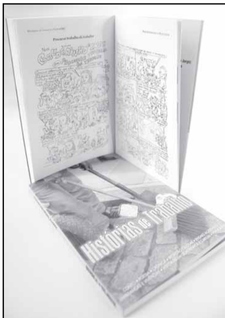
Livro desta edição será lançado em 2010