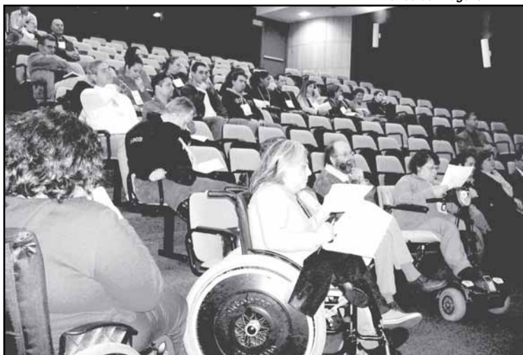
Novas audiências acontecem dias 7 e 14