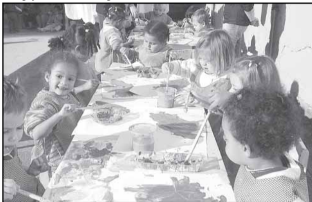
Inscrições para vagas da educação infantil e ensino fundamental nas escolas conveniadas começam em 16 de julho

A Secretaria Municipal de Educação (Smed) está com inscrições abertas para o sorteio de bolsas de estudo para o ensino fundamental/Educação de Jovens e Adultos (EJA), nos cursos conveniados Unificado e Universitário. No caso de vagas para educação infantil e ensino fundamental nas escolas conveniadas com a prefeitura, as inscrições começam em 16 de julho.