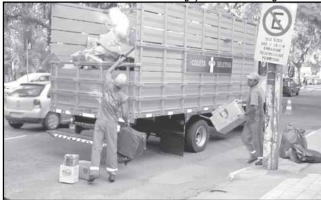
A meta é atingir 100 toneladas de lixo seco retirados diariamente das ruas