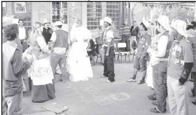
Festividades reúnem comunidade escolar, construindo ambiente positivo