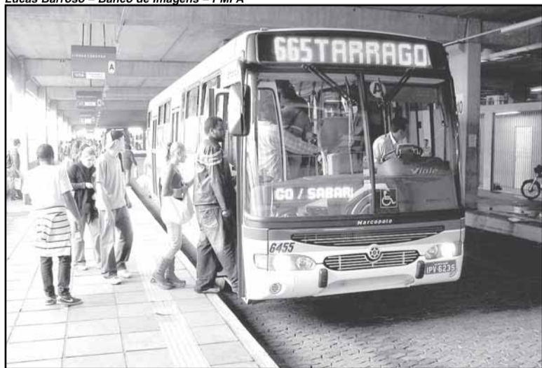
A numeração das linhas recebeu a cor verde e o nome, âmbar

Ficou mais fácil identificar os letreiros dos ônibus de Porto Alegre. Cerca de 200 ônibus da frota já circulam de acordo com o novo padrão estabelecido pela Empresa Pública de Transporte e Circulação (EPTC): 22,8cm para a altura do nome e do número das linhas, com largura de 1,30m. A medida significa um aumento de oito centímetros na altura e