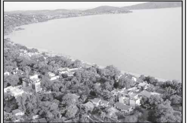
Acervo do projeto está sendo montado com apoio da comunidade