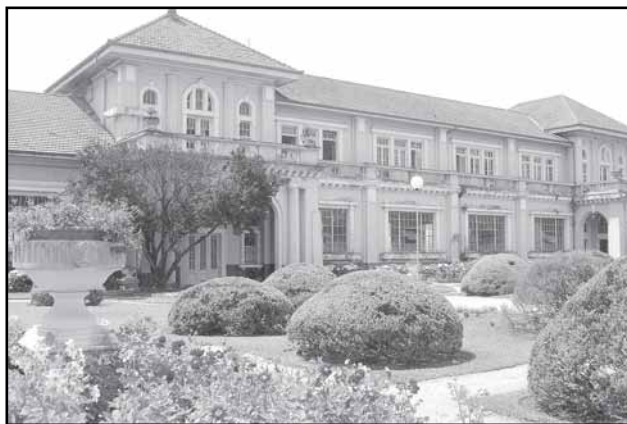
Hidráulica Moinhos de Vento fará parte do roteiro

Centro a Pé são realizadas duas vezes por mês, sempre aos sábados, orientadas por professores especialistas em história ou arquitetura. Esta edição é realizada pelas secretarias do Planejamento Municipal (SPM) e da Cultura (SMC), Programa Viva o Centro e Gabinete da Primeira-Dama, com apoio da Carris.