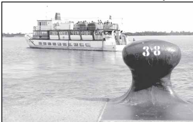
Passeios com o Cisne Branco integram as atrações da cidade