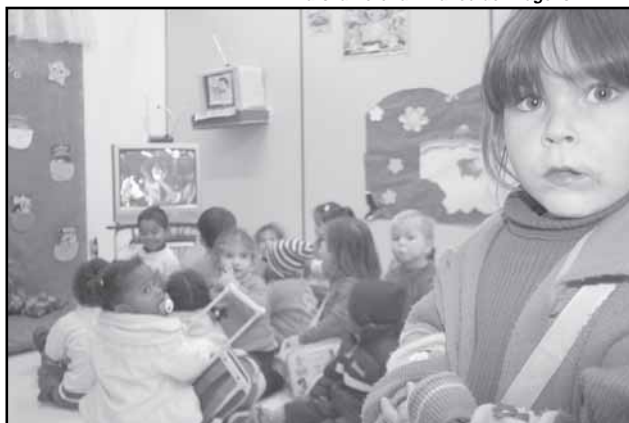
Até agosto, o número de crianças nas creches passará de 11 mil para 13 mil

O número de alunos atendidos pelas creches conveniadas vem aumentando desde 2000, quando foram realizados 7.835 atendimentos às crianças. As creches recebem as verbas por faixas de repasse, que variam de acordo com a quantidade de