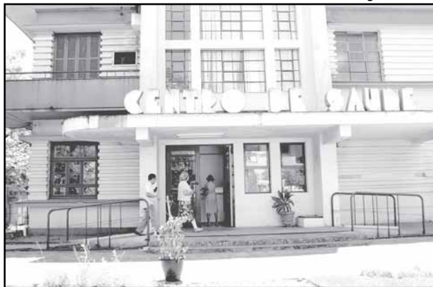
Centro Modelo é uma das unidades que passa a atender até as 22h

Telefone: 3259-1247 — UBS Ipanema — Avenida Tramandaí, 351 - Ipanema Telefone: 3246-7099; — UBS Tristeza — Av. Wenceslau Escobar, 2442 - Tristeza Telefone: 3268-8703 — UBS Camaquã — Rua Professor Doutor João Pitta Pinheiro Filho, 176 - Camaquã, Telefone: 3249-2799 — UBS Bananeiras — Av. Cel. Aparicio Borges, 2494 - Partenon Telefone: 3336.3284; Obs: A UBS Bananeiras estará funcionando a partir da metade da próxima semana; — Centro de Saúde Modelo — Rua Jerônimo de Ornellas, 55 - Farroupilha Telefone: 3289-2555