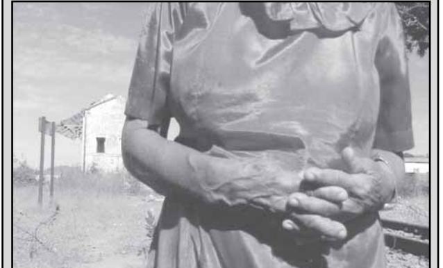
Lerinda na Estação