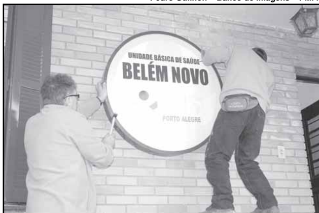
Prédio abrigará a unidade até que antigo posto seja recuperado

O novo local de atendimento conta com quatro consultórios médicos, sala de triagem e sala de vacina. O posto funciona das 8h às 22h.