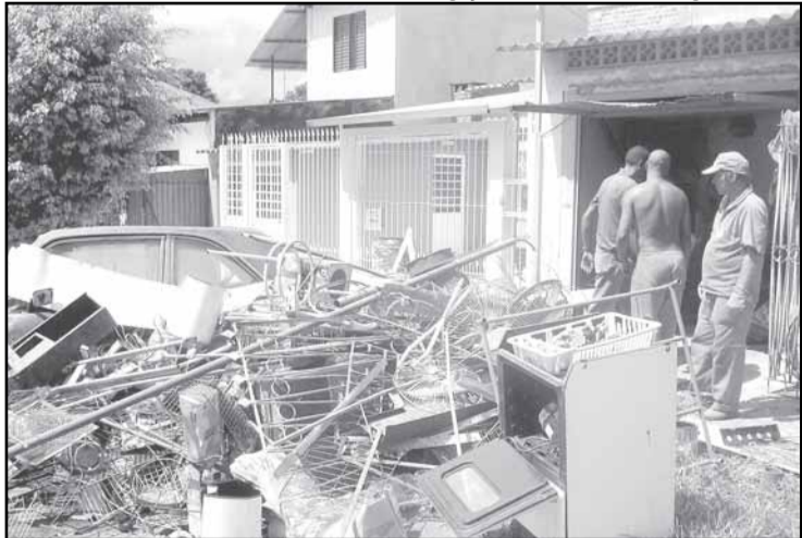
Programa garante a remoção de materiais que não são recolhidos pelas coletas domiciliar ou seletiva