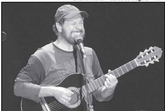
João Bosco é um dos destaques da programação, homenageando Elis Regina