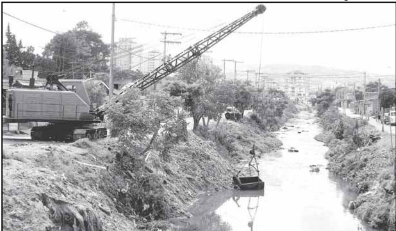
Região do Arroio Cavalhada vai ganhar um parque linear