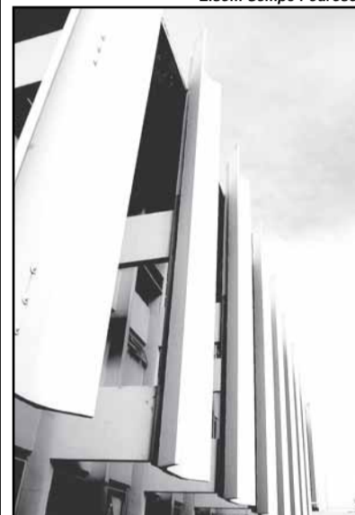
Fachada da CMPA

mara Municipal de Porto Alegre, além de boa música. Este ano, no dia 24 de maio, a Rádio Câmara transmitiu ao vivo a partida beneficente entre os vereadores da Capital e deputados estaduais, com a vitória dos vereadores por 2 a 1. A emissora vem sendo sintonizada em várias partes do