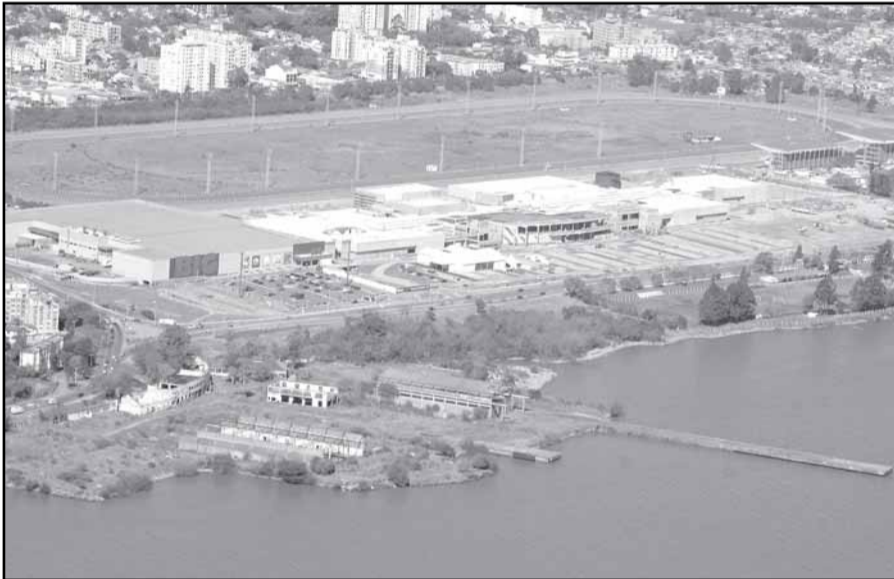
Votação definirá se área do Estaleiro Só terá comércio e residências