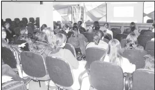
Estagiários recebem capacitação para o trabalho nas comunidades

O projeto Primeira Infância Melhor – Porto Infância Alegre (Pim-Piá) está em busca de parcerias com instituições de nível superior de Porto Alegre. O objetivo é incluir a ação nas atividades complementares de cursos como Pedagogia, Psicopedagogia, Psicologia, Enfermagem e Serviço Social e, assim, oferecer vagas para estágios no programa.