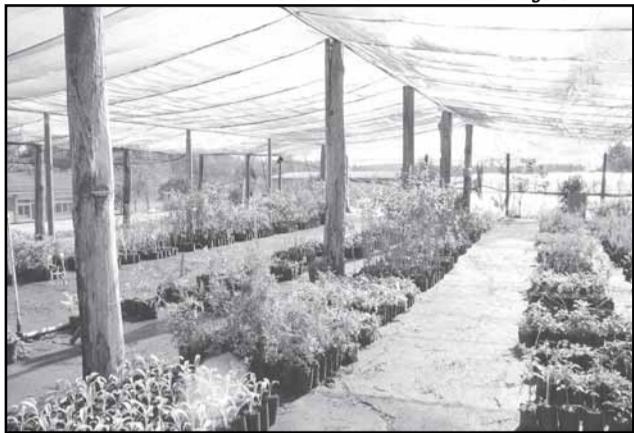
Centro Agrícola Demonstrativo desenvolve pesquisas de novas plantas e tecnologias