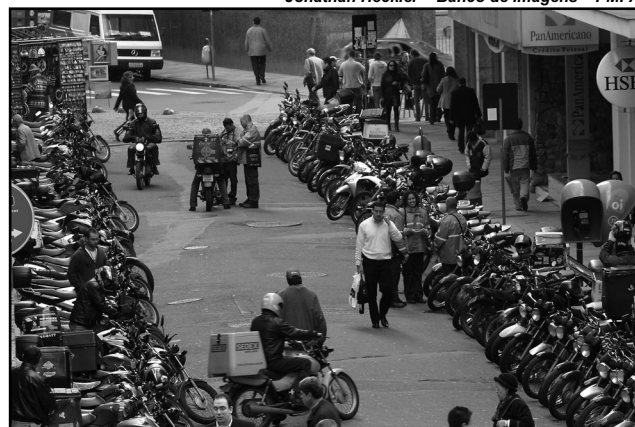
Capital registra circulação de 72 mil motos