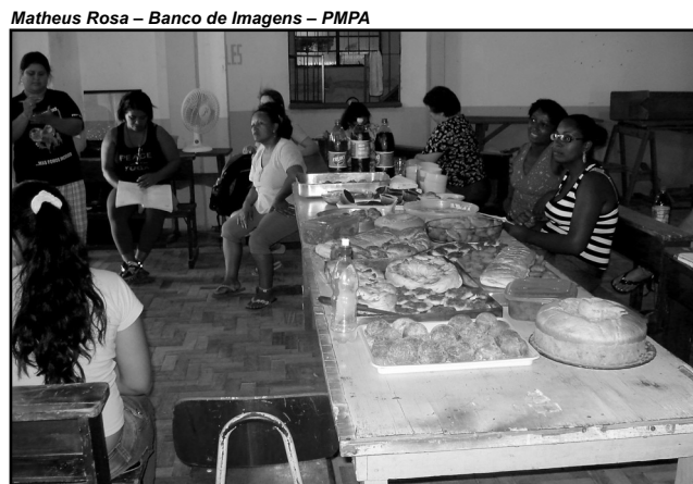
Pratos da formatura serão feitos pelas próprias alunas do curso de culinária

As alunas que participaram dos cursos de culinária estão responsáveis pelos pratos que serão servidos no evento. A empresa Vonpar terá participação na formatura, com a doação de refrigerantes. O evento contará com a presença do secretário municipal da Produção, Indústria e Comércio que entregará os certificados às formandas.