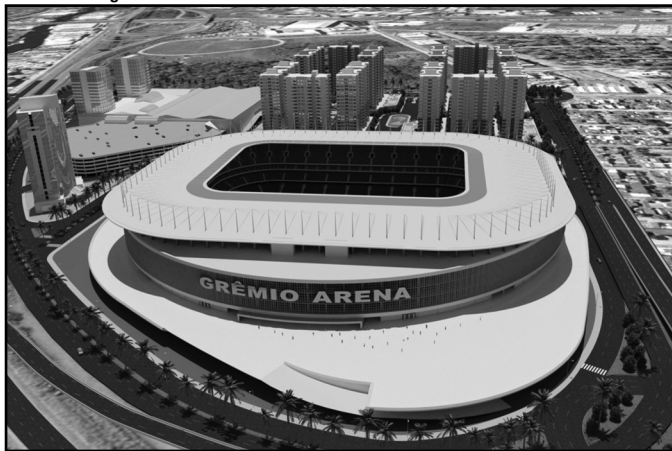
Complexo da Arena prevê prédios residenciais, hotel, centro comercial e de eventos

viabilidade ambiental e estabelecendo os requisitos básicos e condicionantes a serem atendidos nas próximas fases de implantação. Não autoriza o início das obras.