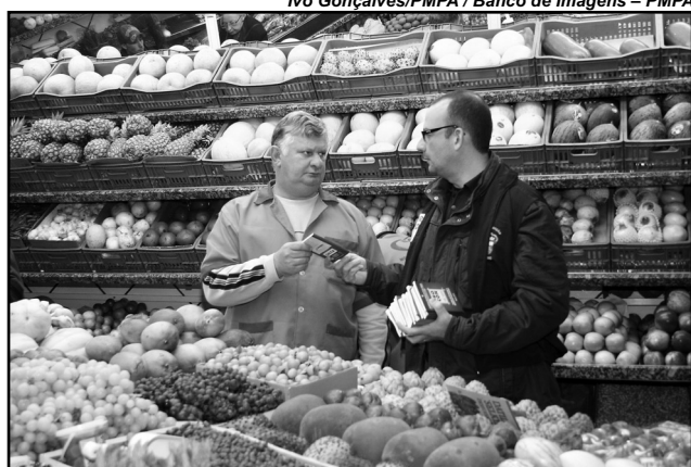
Cópias foram distribuídas no Mercado Público

T odos os estabelecimentos comerciais e de prestação de serviços do país são obrigados a dispor de pelo menos um exemplar do Código de Defesa do Consumidor, (CDC) - Lei 8.078/90 - nas dependências de seus pontos de comércio, viabilizando a consulta dos cidadãos aos seus direitos nas relações de consumo com fornecedores. A Lei em vigor desde a última quarta-feira, 21, estabelece que o CDC deve ser disponibilizado para consulta em local visível e de fácil acesso ao consumidor. A intenção do legislador é promover a popularização do CDC, Lei criada há quase 20 anos que constitui um marco na concretização dos direitos dos consumidores e visa garantir a qualidade e segurança de produtos e serviços comercializados no mercado brasileiro.