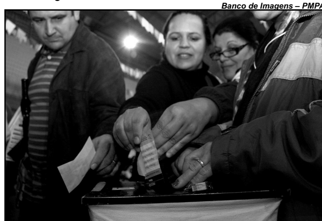
Módulos tratarão do funcionamento das instituições e dos direitos dos cidadãos

Sistema PGLP - O CapacitaPOA integra o Sistema Intermunicipal de Capacitação em Planejamento e Gestão Local Participativa (Sistema PGPL), do qual fazem parte cidades da América Latina e Europa, e está estruturado na Escola de Gestão Pública da Secretaria Municipal de Administração (SMA) de Porto Alegre.