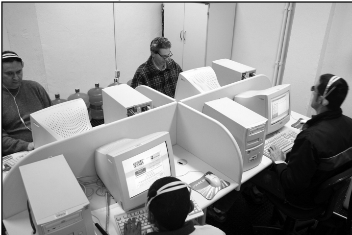
Aulas começam dias 10 e 12 de agosto