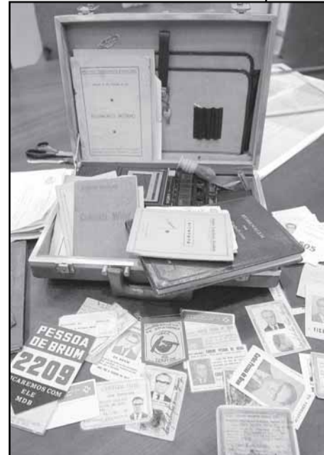
Acervo foi recebido pela Casa em 2009

Textos elaborados e de responsabilidade da Assessoria de Comunicação da Câmara