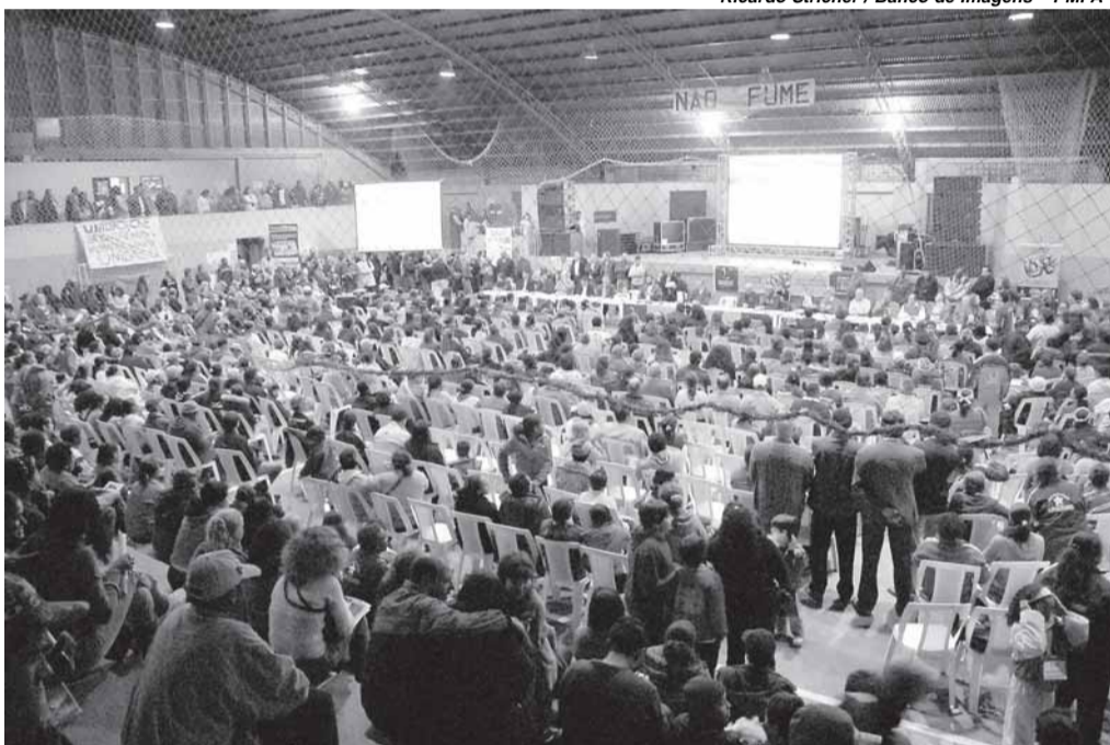
Previsão de receita e despesa será apresentada no encontro