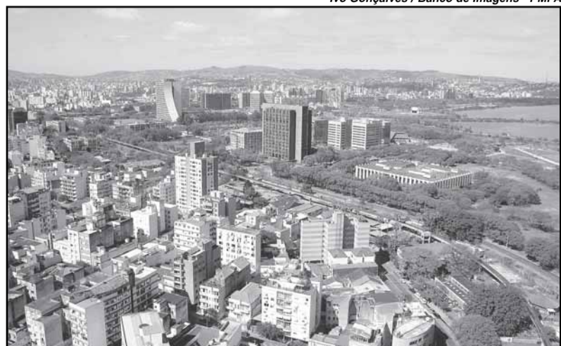
Objetivo é eliminar tributação diferenciada para imóveis de mesmo valor

O objetivo é ajustar distorções e irá corrigir uma defasagem de 17 anos da planta, porém mantendo o atual nível de arrecadação. Em debate com a sociedade, a prefeitura pretende adequar a cobrança do IPTU aos diferentes estágios de desenvolvimento dos diversos setores da cidade, eliminando in-