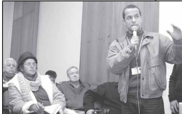
Apresentação do programa A Receita é Saúde aos conselheiros