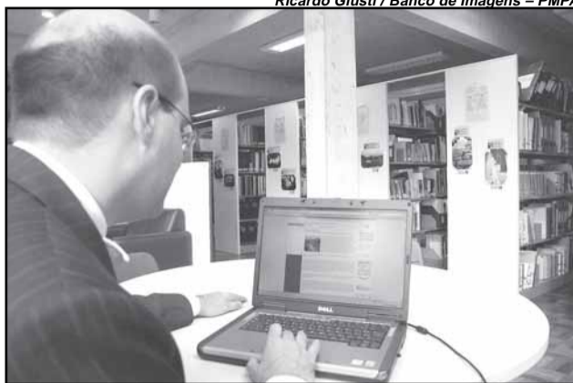
Ricardo Giusti / Banco de Imagens - PMPA