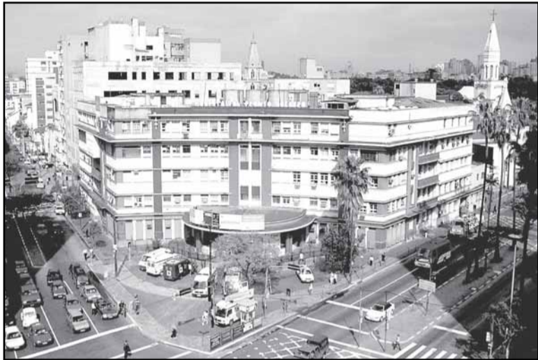
Hospitais, como o HPS, estão aptos a atender casos suspeitos