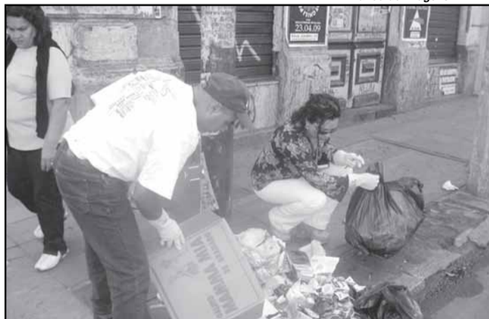
Departamento verifica focos de lixo em locais inapropriados

Esta semana, o alvo foi a avenida Érico Veríssimo e áreas adjacentes, no bairro Menino Deus. Enquanto os servidores da seção sudeste removiam a sujeira e limpavam as ruas, alguns moradores próximos eram visitados e orientados pela equipe da Assessoria Comunitária a dispor o lixo na calçada nos dias e hora da passagem do caminhão de coleta. E recebiam a informação de que, em caso de testemunharem alguma infração, podem denunciar imediatamente pelo Telefone do Cidadão, o 156, ou diretamente ao DMLU, pelo telefone 3289.6999.