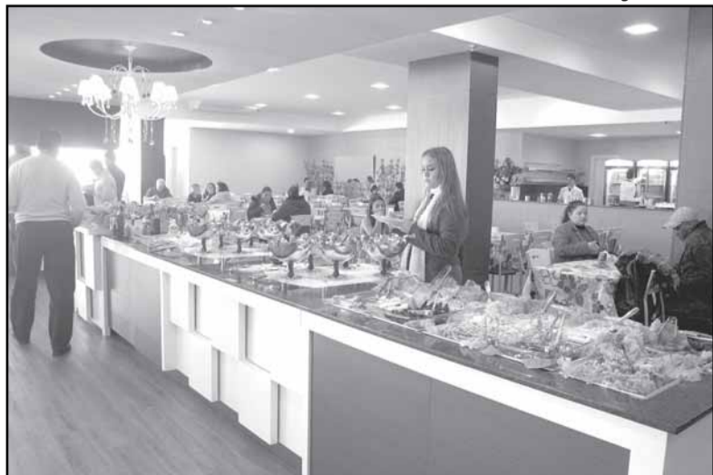
Previsão do empreendedor é servir uma média de 700 refeições

Começou a funcionar no terraço do Shopping Porto (camelódromo), o restaurante Sabor Barbosense. O novo empreendimento tem capacidade para 260 pessoas e pretende