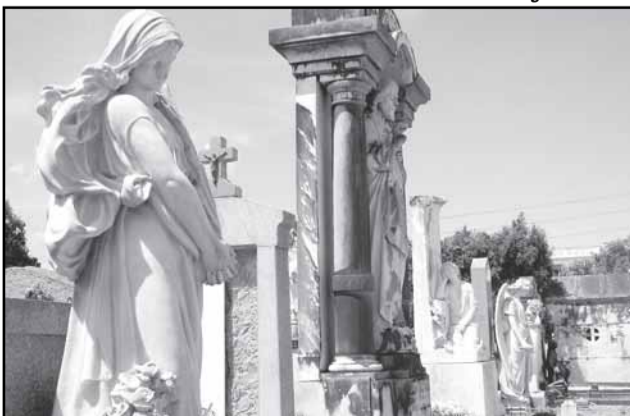
Roteiros orientados acontecem duas vezes por mês