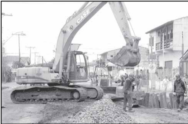
Sistema terá investimentos de R$ 285 milhões no prazo de quinze anos