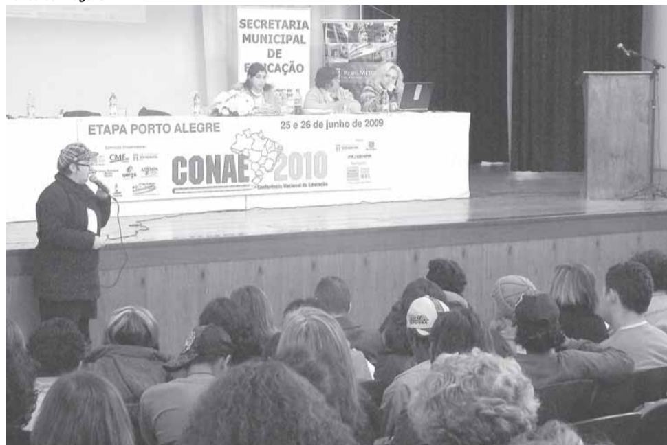
Etapa estadual será realizada em outubro

Ocorreu sexta-feira passada, 26, a plenária que encerrou a etapa municipal da Conferência Nacional da Educação (Conae), realizada no Centro Universitário Metodista (IPA). Alunos, pais, trabalhadores e gestores em educação votaram as resoluções discuti-