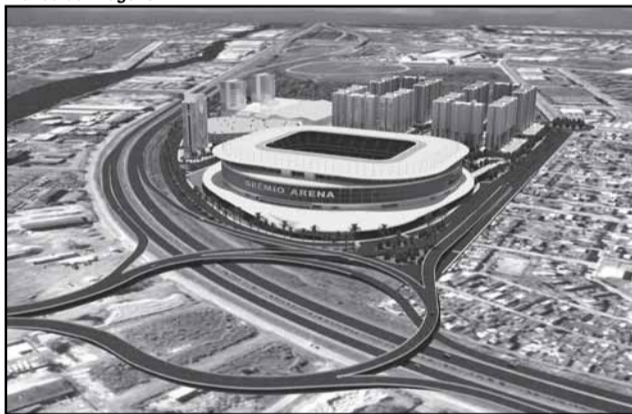
Arena do Grêmio terá 190 mil metros quadrados de área construída

O Estudo de Viabilidade Urbanística (EVU) do projeto Arena do Grêmio foi aprovado, na terça-feira, 1º, por 19 votos a favor e quatro abstenções pelo Conselho Municipal de Desenvolvimento Urbano Ambiental, presidido pelo secretário municipal do Planejamento. O EVU indica as medidas compensatórias do impacto provocado pelo empreendimento para que o projeto seja aprovado.