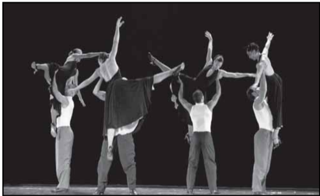
Ballet da Cidade de São Paulo abriu semana do Brasil na Expo

Xangai - A comitiva de Porto Alegre que participa da Expo Xangai assistiu nesta quarta-feira, 2, ao seminário Brasil-China 2010 e adiante: Comércio, Investimento e Oportunidades de Negócios , promovido pelo Ministério das Relações Exteriores. Mais de 300 empresários e investidores, brasileiros e chineses, participaram do evento, que teve como destaque a presença do ministro da Fazenda, Guido Mantega.