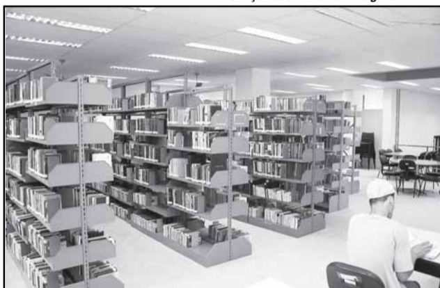
No acervo, Literatura, publicações didáticas e técnicas, periódicos, CDs e DVDs

Essas obras se juntam a um acervo que reúne tanto Literatura quanto publicações didáticas e técnicas, periódicos, CDs e DVDs - mais de 45 mil exemplares - distribuídos entre as bibliotecas municipais Josué Guimarães, no Centro Municipal de Cultura, e da Restinga, no Centro Administrativo Regional do bairro.