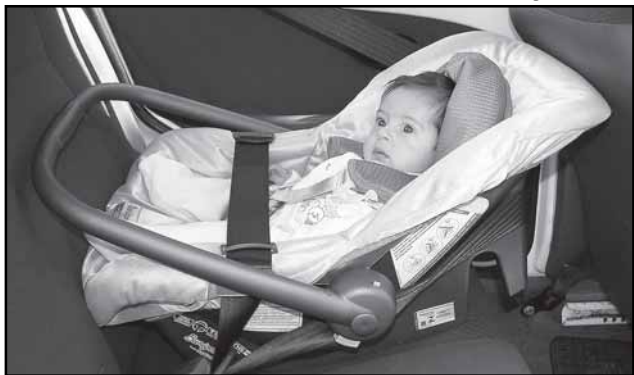
Bebês com até um ano devem ficar no sentido inverso à marcha do veículo

277 do Contran estabelecia, anteriormente, a data de 9 de junho, quarta-feira, para fiscalização e multa no caso do não-cumprimento das normas. Fiscais da Empresa Pública de Transporte e Circulação (EPTC) continuarão orientando os motoristas sobre a resolução.