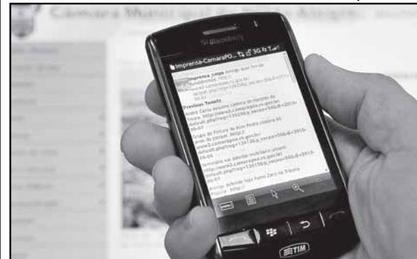
Imprensa da CMPA está no Twitter e no Facebook