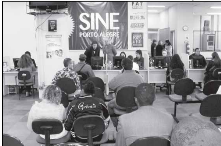
Sine capta vagas junto a empresas interessadas e disponibiliza ao público