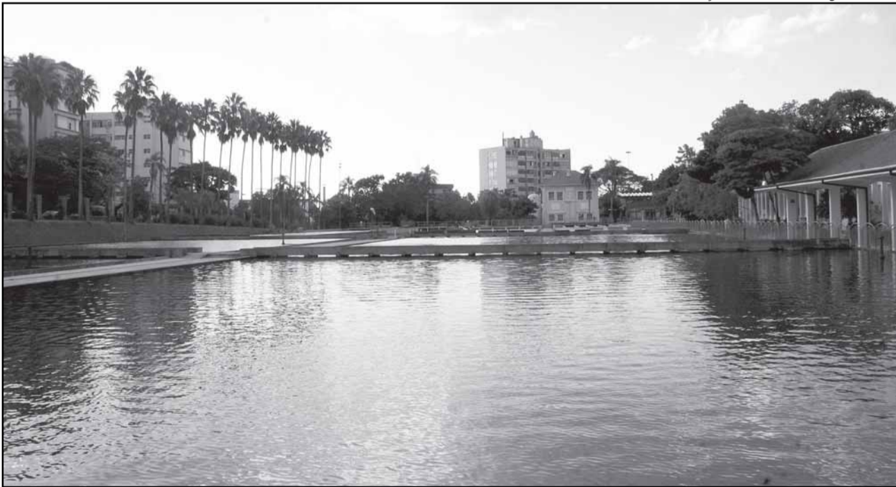
Porto Alegre é exemplo em tratamento e distribuição de água a preços acessíveis

Procempa e Carris — A Procempa estará representada na Expo Xangai pelo diretor-presidente e pelo coordenador de Relações Institucionais que apresentam, dias 23 e 24, o case “Tecnologia a Serviço do Cidadão”. Os representantes da Procempa farão visitas técnicas agendadas, entre elas à cidade-irmã de Porto Alegre, Suzhou, um dos principais polos mundiais de inovação e tecnologia.