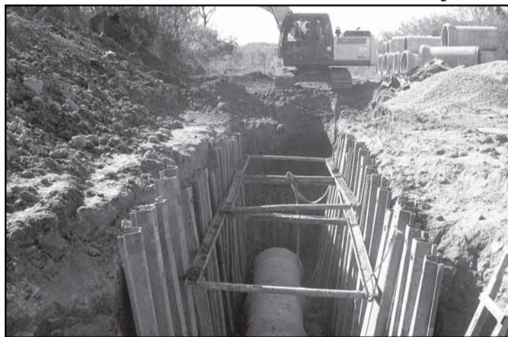
Até o final do mês de maio, foram assentados 2,6 km de tubulações

todas as obras do PISA pode ser conferido pelo site www.portoalegre.rs.gov.br/pisa