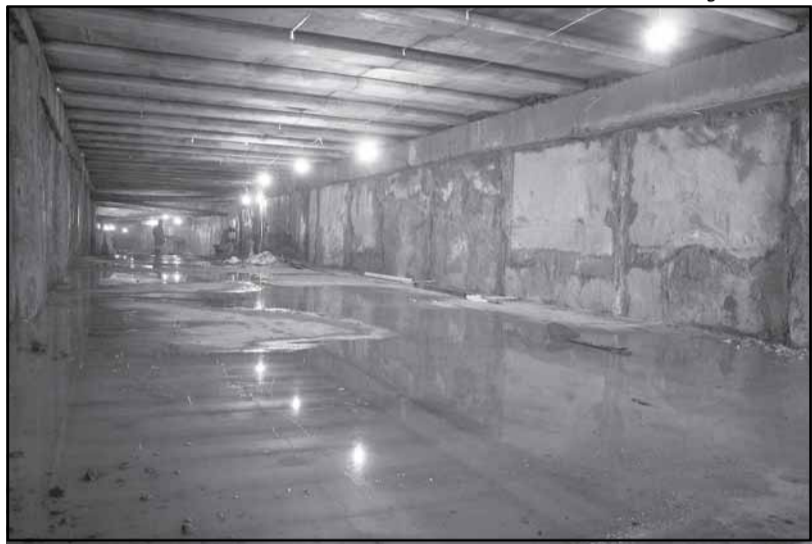
Galerias chegam a ter 7,5 metros de largura