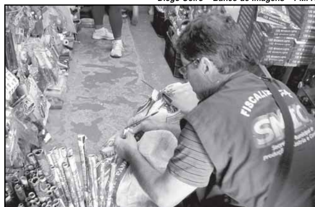
Apreensão de fogos de artifício na Vila Cruzeiro

Conforme a Smic, nessa época de festas juninas, especialmente com os jogos da Copa do Mundo, há um aumento na