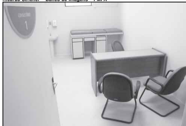
Número de consultas do Centro de Álcool e Drogas supera 90 mil