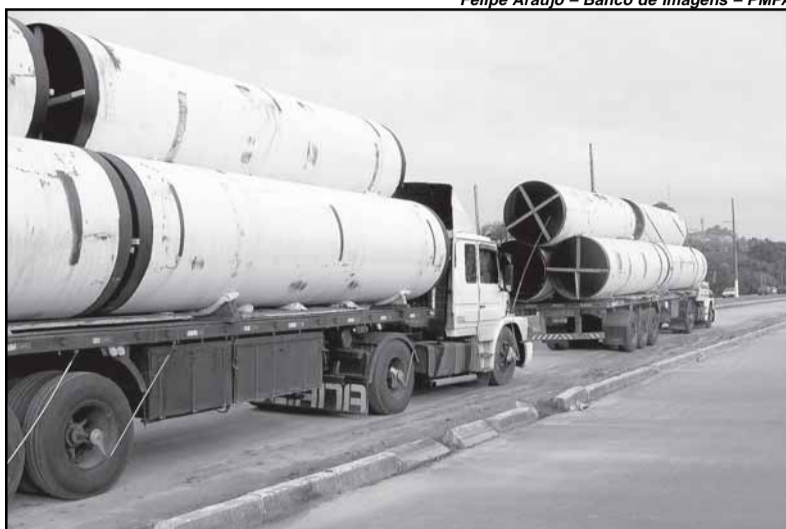
Doze carretas contendo seis tubos de 6,5m chegaram a Porto Alegre

A parte do emissário que será subaquática exigirá utilização de tecnologia inédita em Porto Alegre. Com a realização destas obras, Porto Alegre ultrapassará as Metas