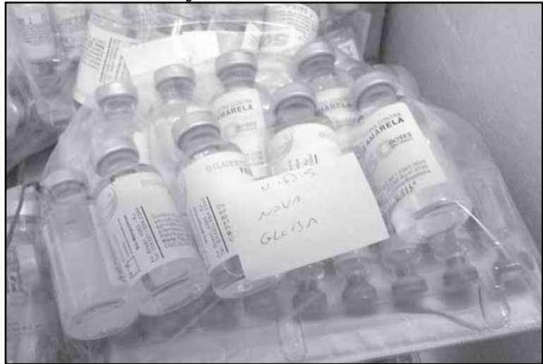
Todos os postos de saúde vacinam contra a febre amarela