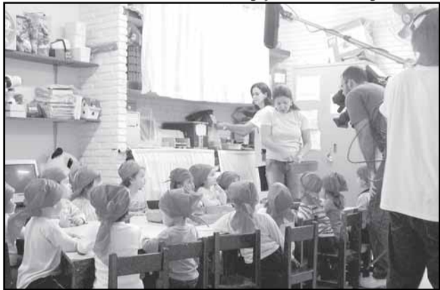
Gravações serão exibidas durante a Semana do Meio Ambiente

com a gravação de atividades, que é referência no assunto.