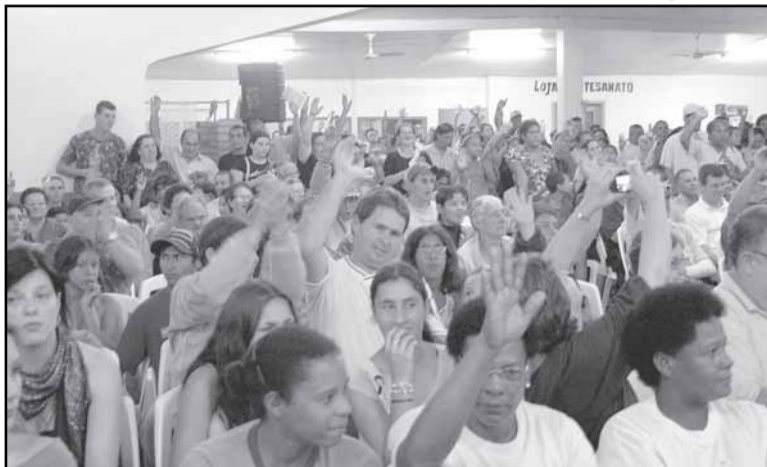
Assembleia teve o maior público desde a implantação do OP na região