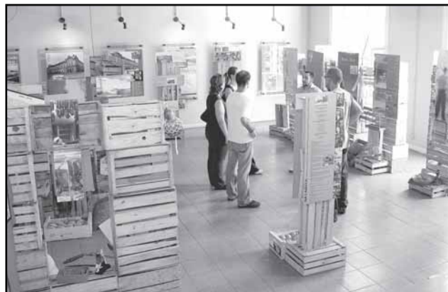
Mercado Público é o único do país a ter seu próprio memorial