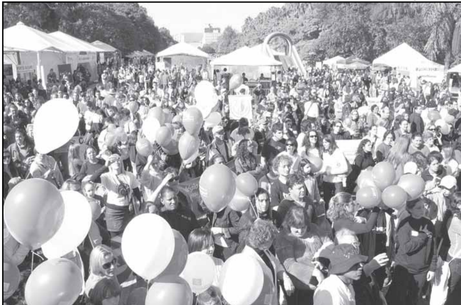
O Dia da Solidariedade integra o calendário de eventos e ocorre sempre no terceiro sábado do mês de maio