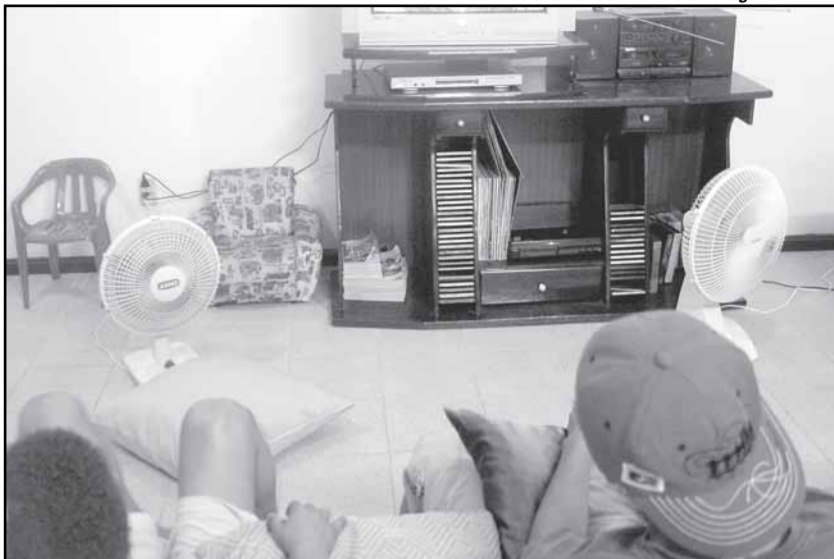
Cada núcleo de atendimento tem uma equipe composta de técnicos e educadores e atua de forma preventiva

As entidades que desejarem se candidatar à execução do atendimento a crianças e adolescentes em situação de rua e suas famílias, na Capital, têm a possibilidade de se inscrever e participar do processo seletivo. A retirada do edital poder ser feita na Fundação de Assistência Social e Cidadania (Fasc), localizada na avenida Ipiranga, 310, com a Coordenação da Rede Básica (CRB), no 4º andar, até o dia 19, das 8h30 ao meio-dia e das 13h30 às 18h. Para se candidatar, a entidade deve estar inscrita no Conselho Municipal dos Direitos da Criança e do Adolescente (CMDCA) e no Conselho Municipal de Assistência Social (CMAS).