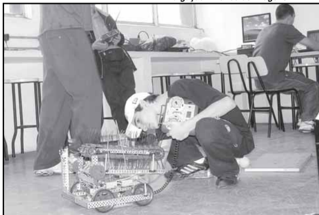
Equipe de robótica da Escola Emílio Meyer disputou o Vex Robotics

Segundo o diretor do HMIPV, a estrutura do ambulatório de planejamento familiar, já existente no hospital, será ampliada para a implantação do Centro. “Futuramente, pretendemos oferecer tratamentos para infertilidade que hoje são pouco acessíveis a casais com menor poder aquisitivo, como a fertilização in vitro ”, revela Casartelli. O acesso ao serviço é feito pela rede de saúde do município. Sessenta e dois por cento das mulheres da Capital estão em idade fértil.