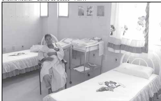
O hospital é referência no atendimento à criança e à gestante