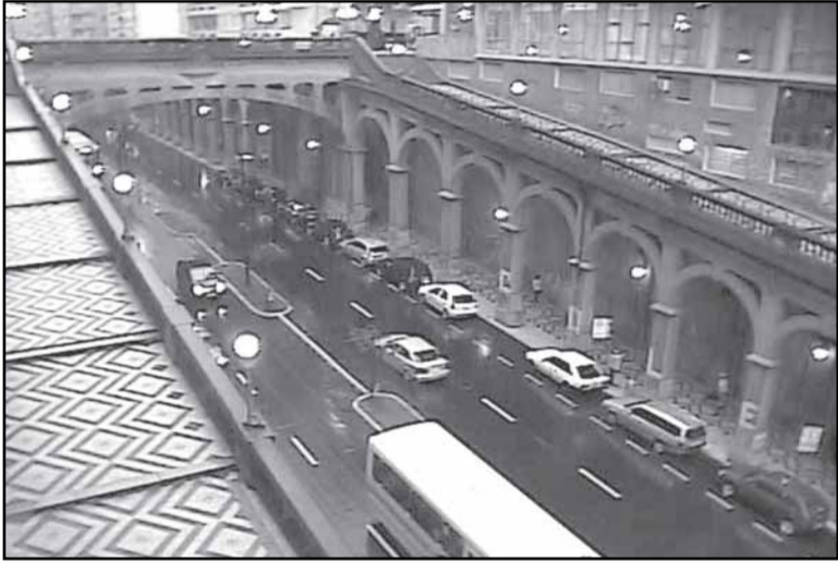
Imagem captada por câmera instalada na parte superior do viaduto