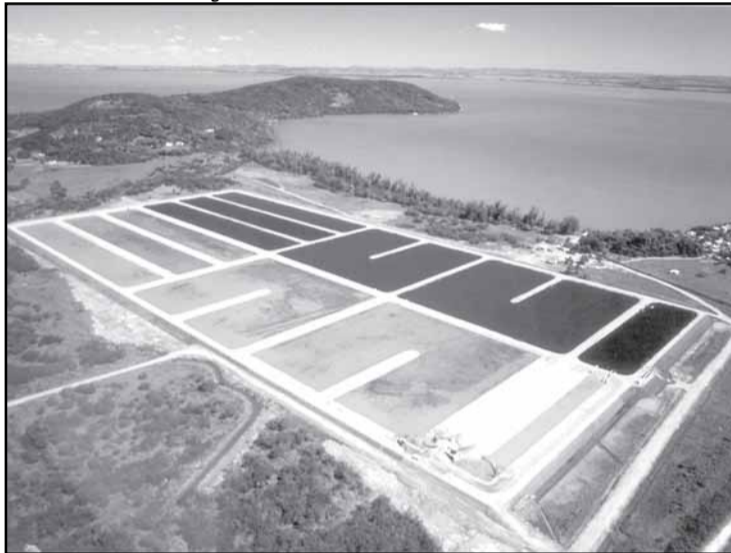
O tratamento completo do esgoto será realizado na moderna estação do bairro Serraria