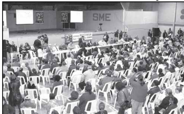
Reunião do OP na Restinga teve 753 inscrições