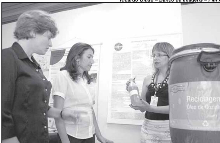
Com os novos postos, já são 124 os locais que recebem o óleo usado

“Muita gente ainda não consegue perceber as obras do Socioambiental porque a rede ainda não foi ligada, mas posso garantir que é a maior obra de toda a cidade”, destacou o prefeito. Ele falou, ainda, sobre o atendimento a demandas reprimidas desde 2001 como a extensão de rede de esgoto e a urbanização das vilas Vale do Salso e Atílio Superti. “De um lado está a decisão soberana da população e, de outro, está o gover-