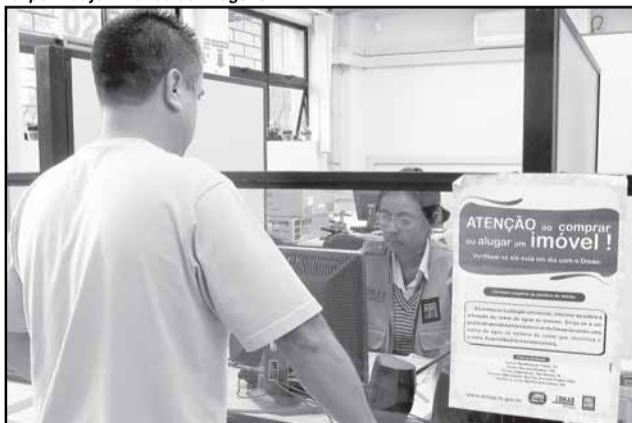
Antes de comprar ou alugar, verifique se há débitos junto ao Dmae

Antes de alugar ou comprar um imóvel, é importante atentar para alguns cuidados que fazem diferença em relação à conta de água. Certificar-se de que não há dívida com o Dmae é o principal deles. Somente durante o ano de 2009, mais de 200 usuários procuraram o Departamento com débitos, tanto em caso de compra como em caso de venda de imóveis.