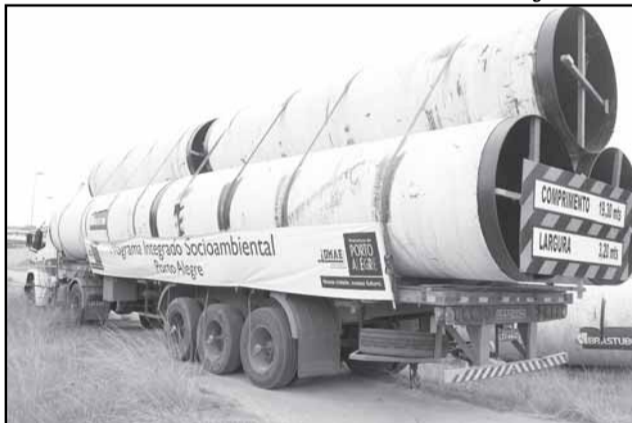
Tubos menores chegam à Capital por via terrestre. Os maiores chegarão pela Lagoa dos Patos, até julho