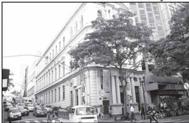
Museu Hipólito José da Costa será um dos locais visitados no roteiro

Antiquários — A feira Caminho dos Antiquários faz parte de programas do governo municipal. Com o objetivo de revitalizar a área central, o