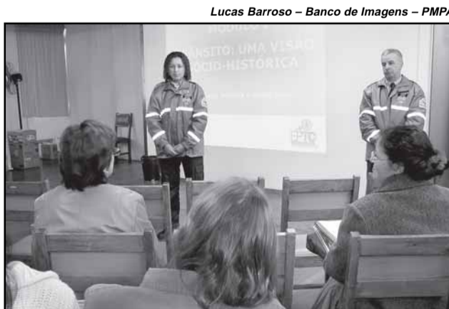
Curso é gratuito, e as aulas começam na quinta-feira

As inscrições devem ser realizadas na 1ª Coordenadoria Regional de Educação (CRE), localizada na rua Sete de Setembro, 666, ou na Assessoria de Educação para o Trânsito da EPTC (rua João Neves da Fontoura, 7). Também é possível se inscrever por e-mail ( educ@eptc.prefpoa.com.br ).