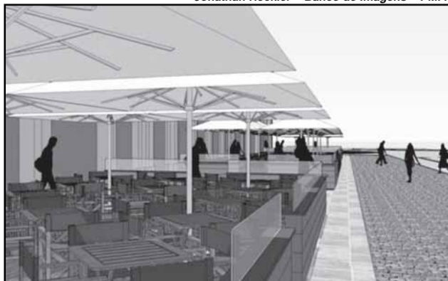
Deck com cobertura no Mercado é umas das melhorias previstas