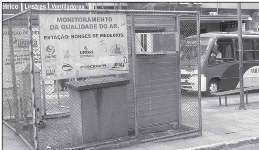
O Analisador de Material Particulado está na esquina das avenidas Borges de Medeiros e Salgado Filho

O Analisador de Material Particulado está localizado na esquina das Avenidas