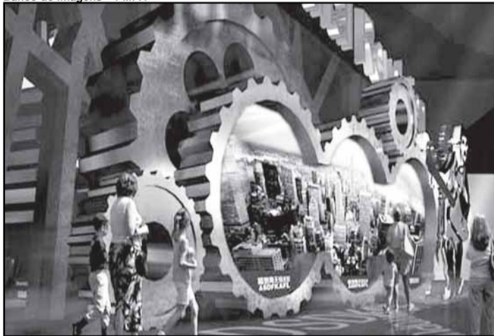
Pavilhões temáticos estimulam reflexões sobre o futuro

Além dos espaços destinados especificamente às nações, instituições, empresas e organizações, a Expo Xangai 2010 traz ambientes dirigidos a reflexões sobre o futuro das cidades, moldados conforme um conjunto de temas que dizem respeito ao cotidiano urbano. São os chamados Pavilhões Temáticos, que têm atraído um grande fluxo de visitantes, levando o público a interagir com outras realidades e absorver conhecimento sobre a evolução da humanidade e de suas formas de organização coletiva.