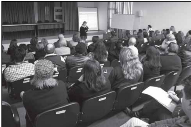
Foram capacitamos 26.937 servidores, em 328 cursos diferentes, com 1.520 turmas/edições