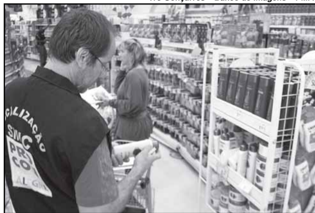
Ações visam atender consumidores e levar informação a lojistas

A página da EGP, ( portoalegre.rs.gov.br/sma ) foi reformulada em 2009, e conta com os seguintes links: apresentação, programação, artigos, educação à distância, educadores, escolas de governo, relatórios, pesquisas de mercado e fale conosco. Na seção de artigos foi disponibilizado um espaço para publicação de textos escritos pelos servidores municipais. Está sendo planejado, para breve, o lançamento da revista digital, com artigos científicos realizados pelos servidores.