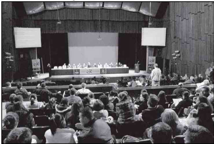
A Rodada Única de Assembleias Regionais e Temáticas do OP 2010-2011 prossegue até o dia 21 de junho