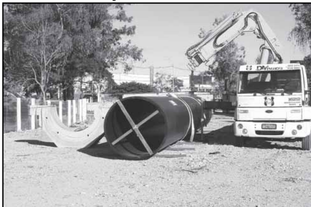
São mais de 480 metros de tubulações com 1,60 m de diâmetro

Chegam a Porto Alegre, nesta semana, mais 40 tubos em