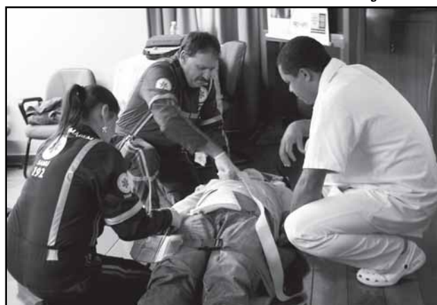
Samu já recebeu mais de 130 mil chamadas em 2010

No primeiro semestre de 2010, o Samu recebeu mais de 130 mil chamadas. O maior número, 45.024, foram de trotes; 19.931 reguladas e 21.248 engano. Do total de chamadas úteis, casos clínicos foram os mais atendidos (3.261), seguidos dos casos de trauma (2.980). Segundo Dinorá, mais de 30% são levados ao Hospi-