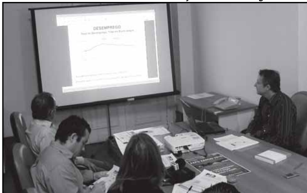
Dados da pesquisa foram divulgados em entrevista coletiva